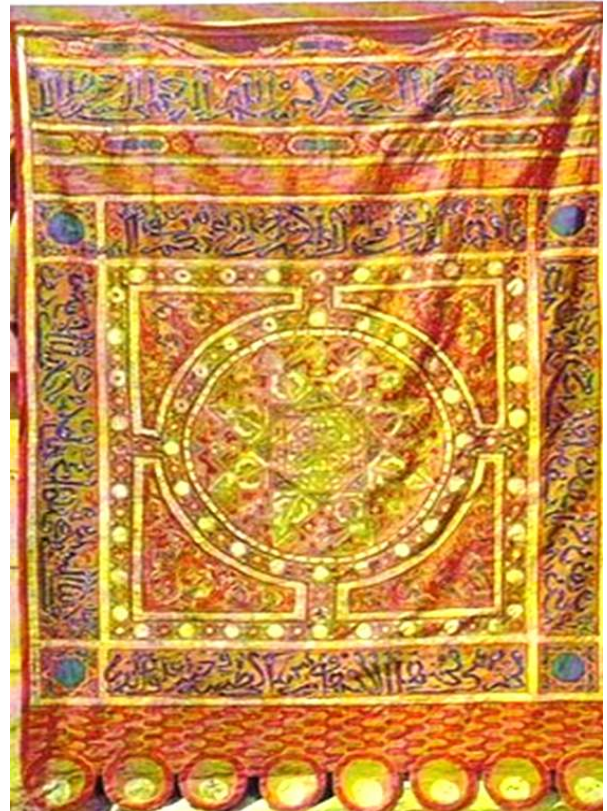
Tapiz árabe del año 1212 "Pendón de las Navas de Tolosa"

Todo este recinto ha estado siempre bajo los grandes poderes y privilegios concedidos a las monjas cistercienses de la Orden de San Bernardo, hasta que los Reyes Católicos lo abolieron. Cuando se nombraba abadesa la hacían escudo de armas y tenía poderes eclesiásticos y civiles, no cabe duda que en aquella época y siendo mujer, era todo un privilegio. Cuando hago este escrito hay 30 monjas cistercienses de clausura. Agradecemos las explicaciones de la agradable guía oficial Srta. Berta.