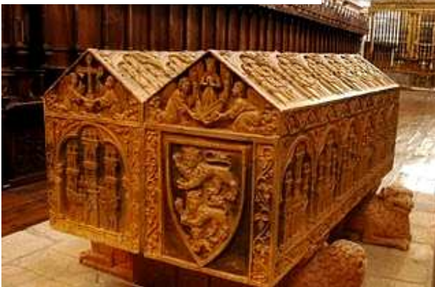
Sepulcro Alfonso VIII y Leonor