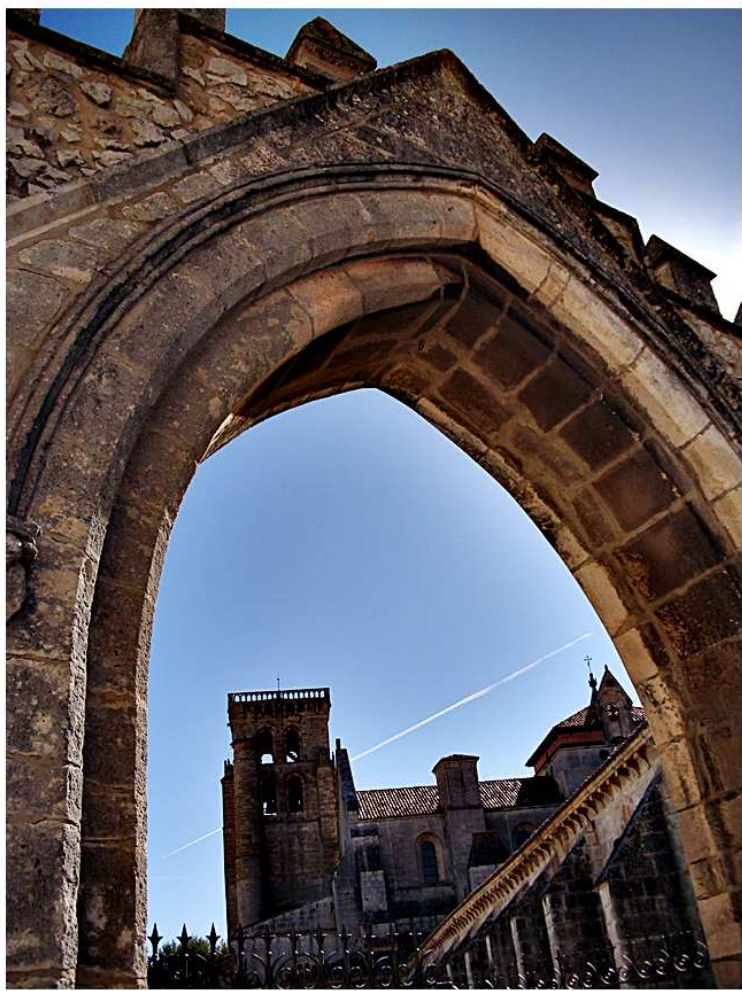
Santa M a La Real de Las Huelgas Monasterio * (Burgos) 09-2010jb