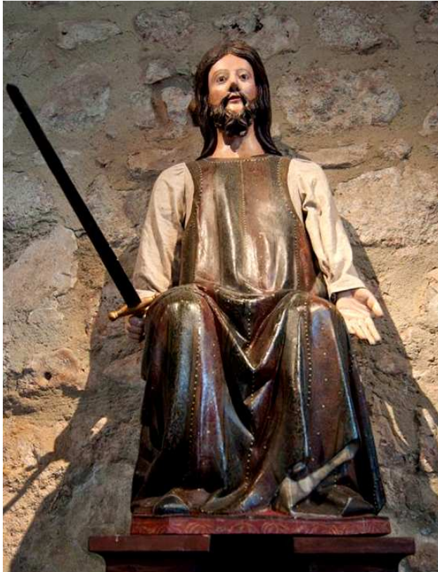
Santiago apóstol con brazo articulado